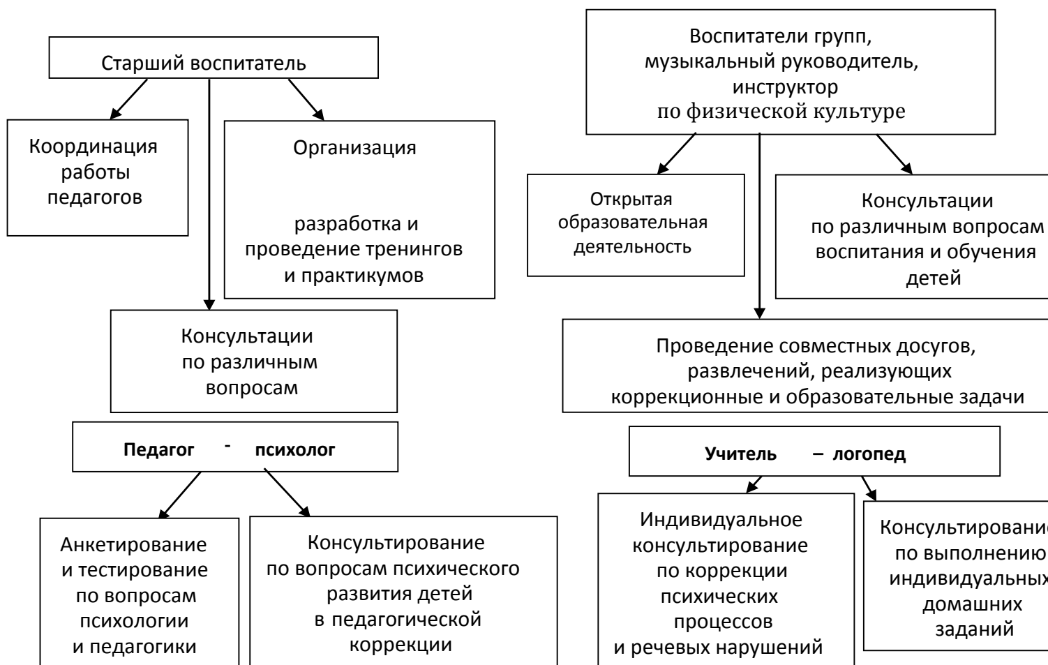
Рис. 1 «Схема взаимодействия с семьями воспитанников»